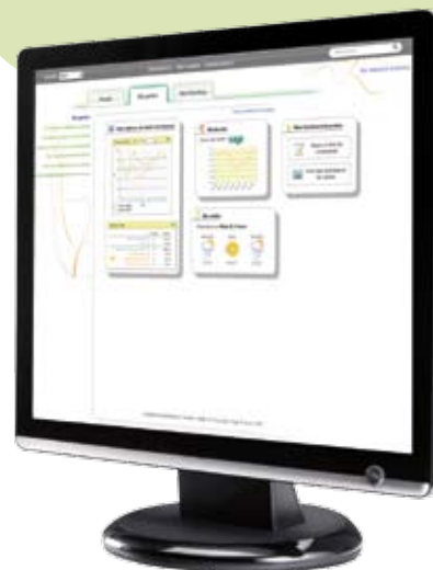
Accédez à votre espace de gestion personnalisée

En atelier de fabrication, le responsable de fabrication peut consulter rapidement les articles à fabriquer, contrôler les délais et l'ordonnancement des fabrications.