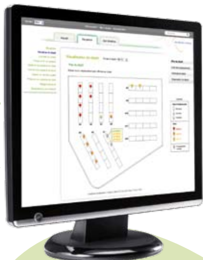
Visualisez l'espace de stockage en un clic

A tout moment - à son bureau, en déplacement - il devient simple de consulter le chiffre d'affaires ou de publier des informations à partager avec les salariés.